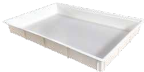
Foglio termoformato / Thermoformed sheet